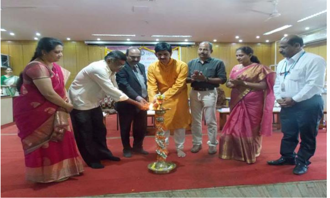
ವಿ.ವಿ.ಕಲಾ ಕಾಲೇಜು ಆಯೋಜಿಸಿದ "ಮಾನವಿಕ" ಅಂತರ ಕಾಲೇಜು ಸಾಂಸ್ಕೃತಿಕ ಕಾರ್ಯಕ್ರಮದ ಉದ್ಘಾಟನೆ

ಕಳೆದ ಶೈಕ್ಷಣಿಕ ಸಾಲುಗಳಲ್ಲಿ ನಮ್ಮ ಕಾಲೇಜಿನ ಹಲವಾರು ಪ್ರತಿಭಾವಂತ ವಿದ್ಯಾರ್ಥಿಗಳು ಭಾಷಣ, ಚರ್ಚೆ, ಗಾಯನ, ಪ್ರಬಂಧ, ಋಷಿಪ್ರತಿ, ನೃತ್ಯ, ಜನಪದ ಕಲೆ, ರಸಪ್ರಶ್ನೆ, ದೃಶ್ಯಕಲೆ ಮುಂತಾದ ಸ್ಪರ್ಧೆಗಳಲ್ಲಿ ಜಿಲ್ಲೆ ಹಾಗೂ ರಾಜ್ಯ/ರಾಷ್ಟ್ರಮಟ್ಟದಲ್ಲಿ ಪ್ರಶಸ್ತಿ, ಪುರಸ್ಕಾರಗಳನ್ನು ಪಡೆದುಕೊಂಡಿದ್ದಾರೆ. ನಮ್ಮ ಕಾಲೇಜಿನ ಅವರಣದಲ್ಲಿ ಸುಸುಜ್ಜಿತವಾದ ಸುಮಾರು 1000 ಆಸನ ವ್ಯವಸ್ಥೆಯುಳ್ಳ ಸಭಾಭವನ ನಿರ್ಮಾಣ ಮಾಡುವ ಯೋಜನೆ ಇದೆ.