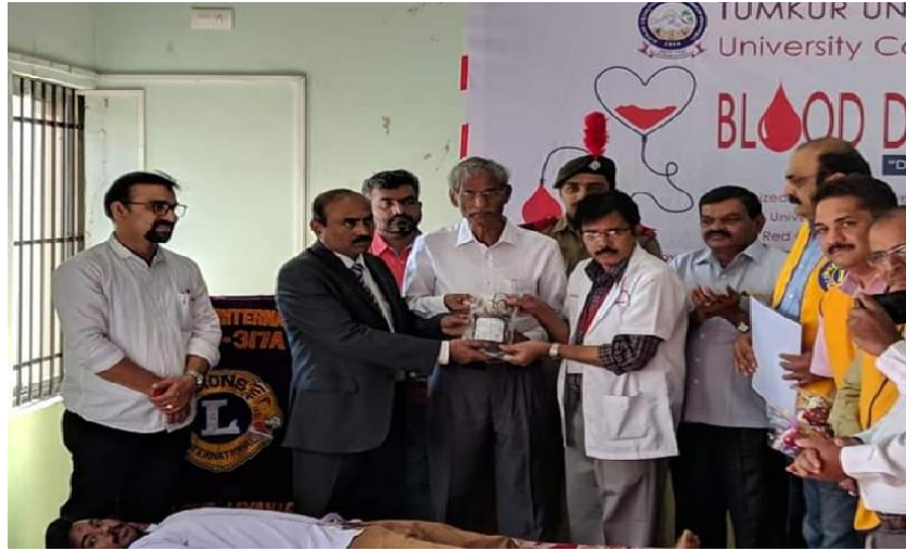
ವಿಶ್ವವಿದ್ಯಾನಿಲಯ ಕಲಾ ಕಾಲೇಜು ನಡೆಸಿದ ರಕ್ತ ದಾನ ಶಿಬಿರದ ಉದ್ಘಾಟನೆ