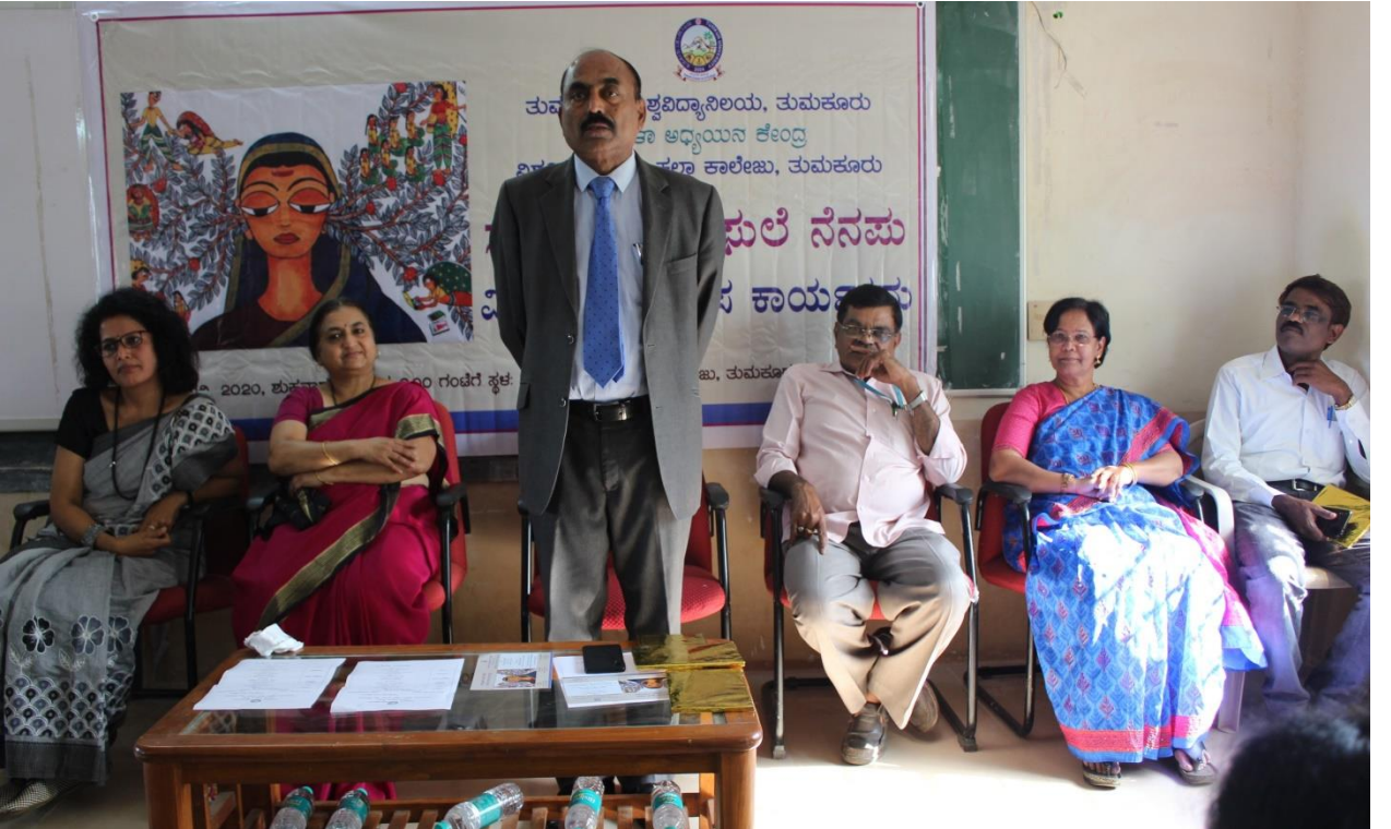
ಮಹಿಳಾ ಶಿಕ್ಷಣಕ್ಕಾಗಿ ಶ್ರಮಿಸಿದ ಜ್ಯೋತಿ ಬಾ ಪುಲೆ ರವರ ನೆನಪು ಕಾರ್ಯಕ್ರಮ