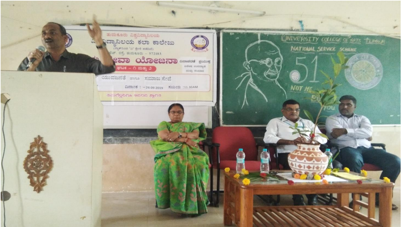
ರಾಷ್ಟ್ರೀಯ ಸೇವಾ ಯೋಜನೆ ದಿನಾಚರಣೆಯ ಸಂಬಂಧ ನಡೆದ ಉಪನ್ಯಾಸ