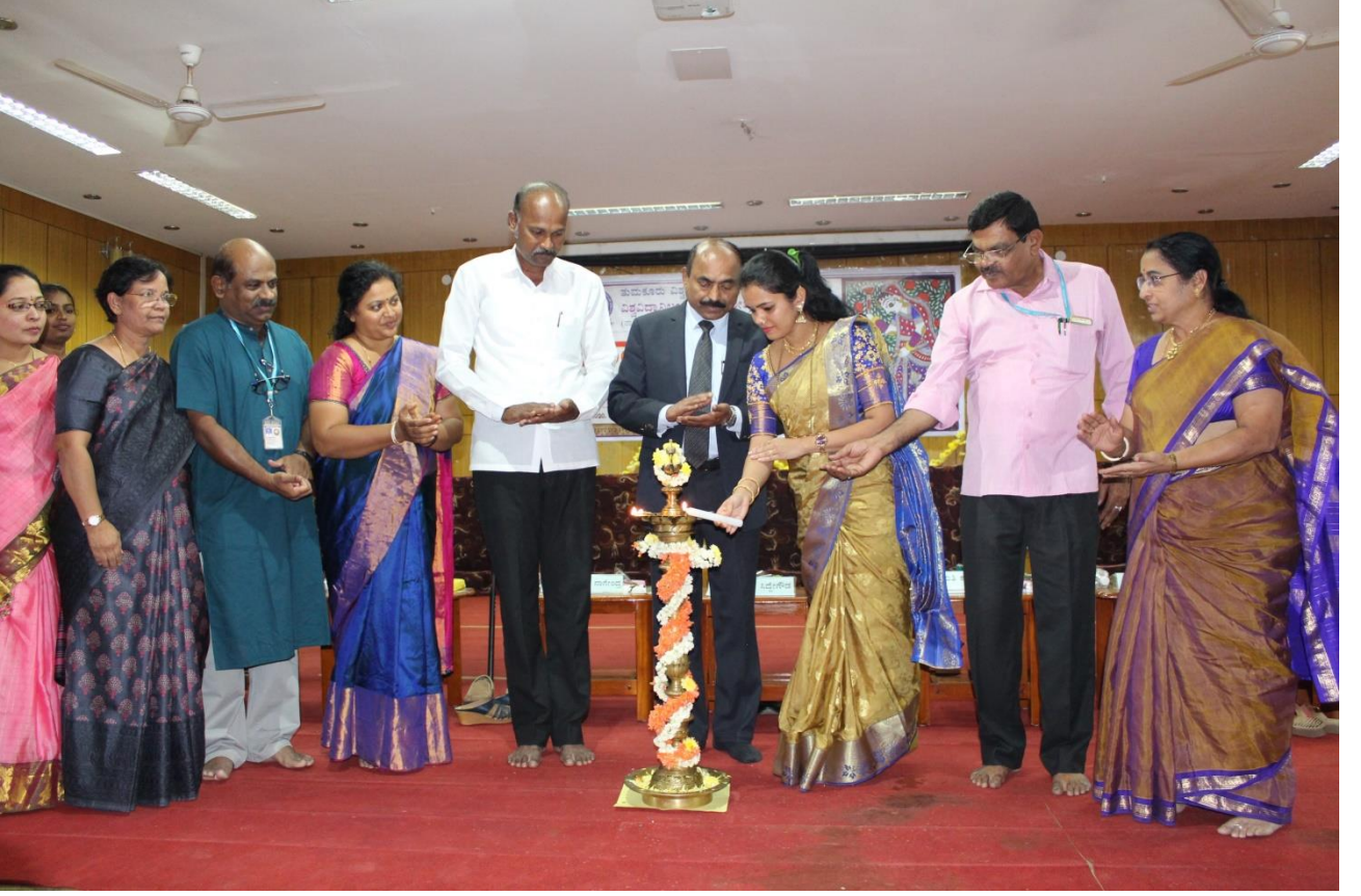
ಮಾನವಿಕ ಕಾರ್ಯಕ್ರಮದ ಉದ್ಘಾಟನಾ ಸಮಾರಂಭ