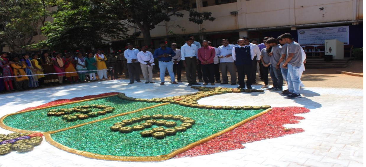
ಜಿ.ಎಫ್.ಎ ವಿದ್ಯಾರ್ಥಿಗಳಿಂದ ವಿಶ್ವ ಶಿಕ್ಷಣ ದಿನದ ಆಚರಣೆ