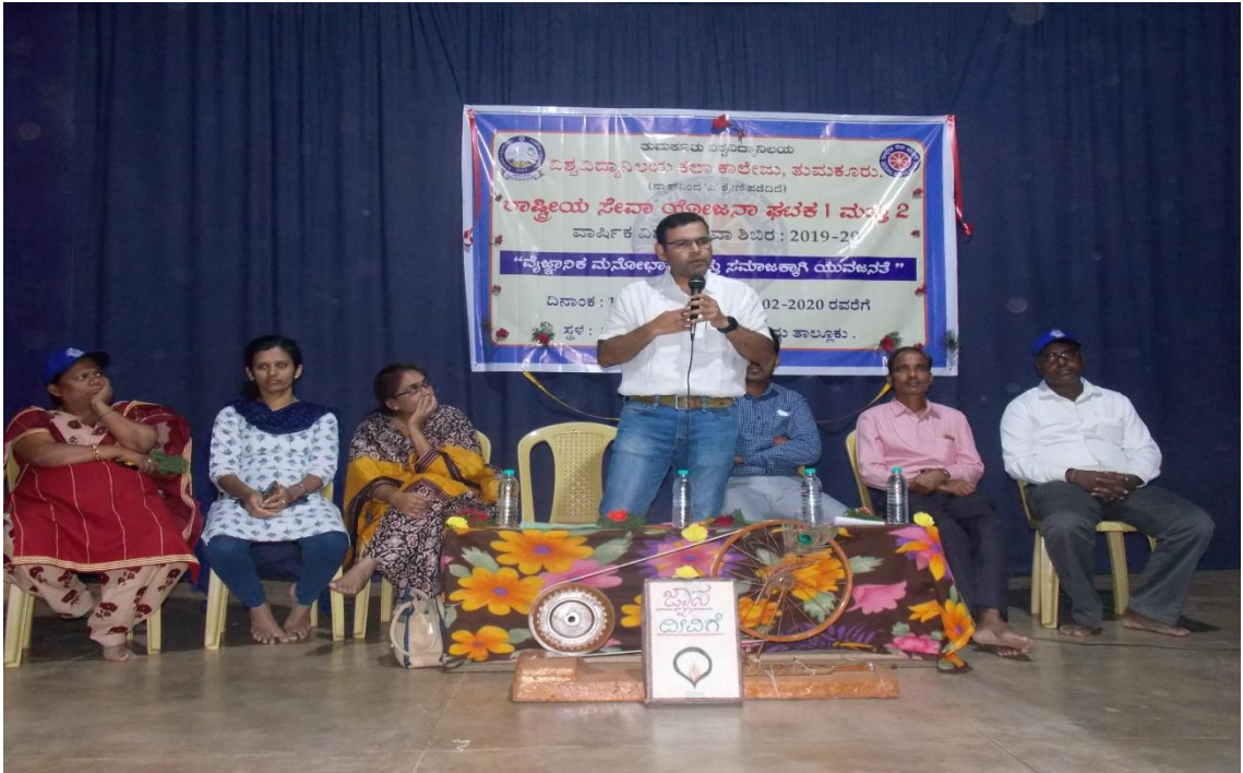
NSS Annual Special Camp Inaugural Function