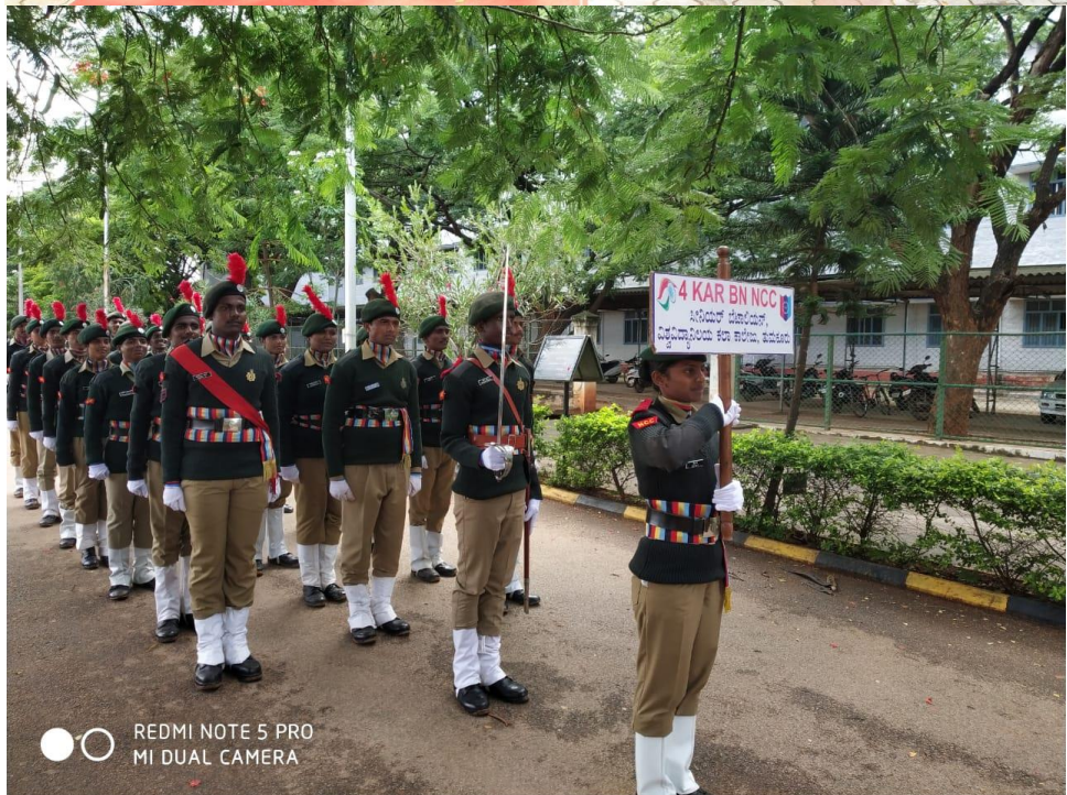
NCC Cadets of University College of Arts, Tumkur