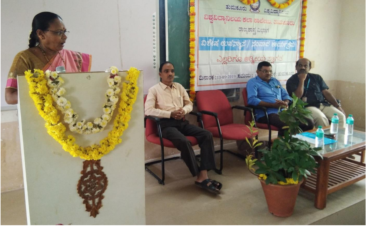
ವಿಶ್ವವಿದ್ಯಾನಿಲಯ ಕಲಾ ಕಾಲೇಜನ ರಾಜ್ಯಶಾಸ್ತ್ರ ವಿಭಾಗದ ವಿಶೇಷ ಉಪನ್ಯಾಸ ಮತ್ತು ಸಂವಾದ