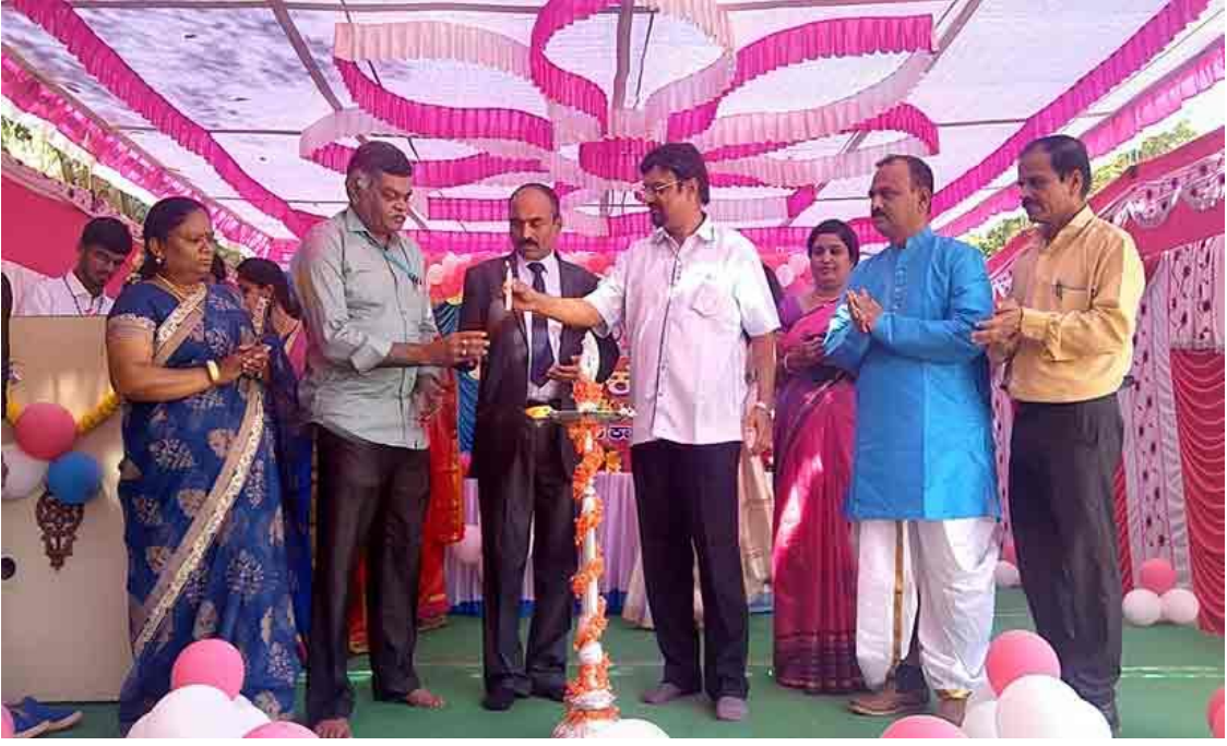
Inauguration of "Sankalpa" Cultural Programme of Univ. College of Arts